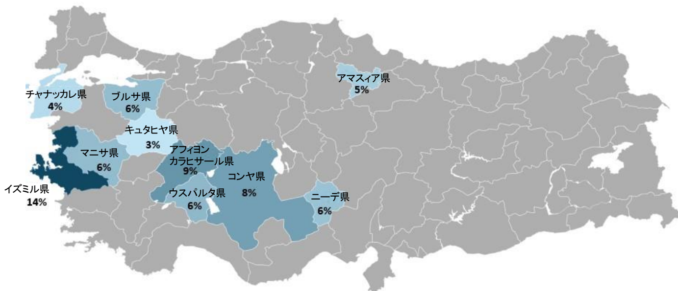
図1 トルコの主要甘果アウトウ産地