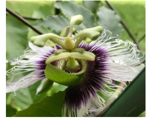
写真: パッションフルーツの花